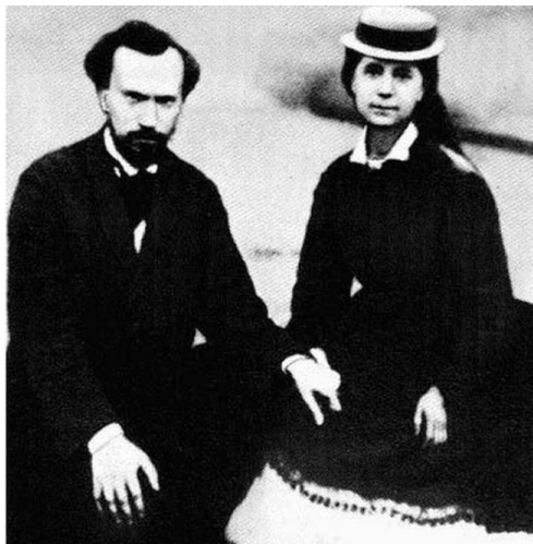
Paul Lafargue y Laura Marx

A pesar de todas sus fallas y debilidades, la historia le reservará un puesto de honor entre los pioneros del proletariado internacional; poco importa que le discutan ese puesto los filisteos, mientras los haya en el mundo, tanto aquellos que se cubren las largas orejas con la gorra policial como los que pretenden encubrir sus miserias bajo la piel de león de un Carlos Marx.