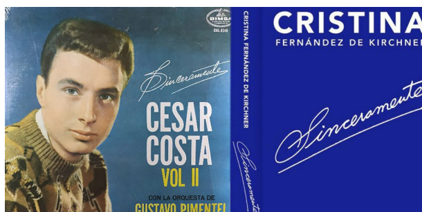
La gráfica del libro ha resultado ser un plagio de un viejo y cursi LP de un “Palito Ortega” Mexicano

El libro que bien podría considerarse un absurdo editorial inacabado y pegajoso, escrito por una adolescente, no logra salvar 50 páginas de las más de 600, plagadas de lugares comunes y anécdotas irrelevantes y retorcidas. Cinismo del peor estilo porteño.